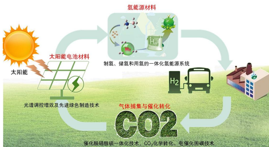
图 2 “液态阳光”材料技术

氢技术；开发吸放氢动力学可控的高容量轻质镁基储氢材料，设计制备低压复合储氢器件；建立高性能和高稳定性的 SOFC 电极、电解质的关键制备技术，构筑高比能、可持续氯离子电池、镁二次电池和新型高压、多电子锰-氢水系电池；实现可控制的制氢、储氢和用氢的氢能源系统一体化。开发安全高效的低成本动态催化脱硝脱硫一体化技术，发展 CO 2 化学转化、电催化固碳技术。